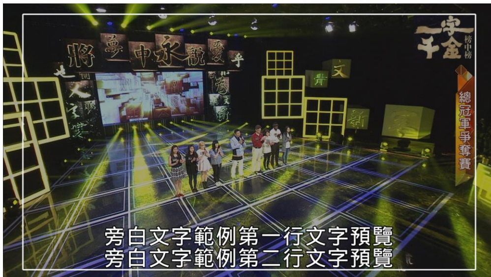
（上圖標示為 16：9 字幕安全框）